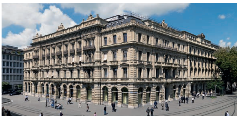
スイス・チューリッヒにあるクレディ・スイス・グループ本拠地