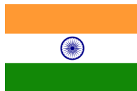
通貨:インド・ルピー