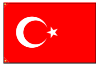
通貨:トルコ・リラ