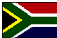
通貨: 南アフリカ・ランド