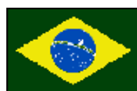
通貨: ブラジルリアル